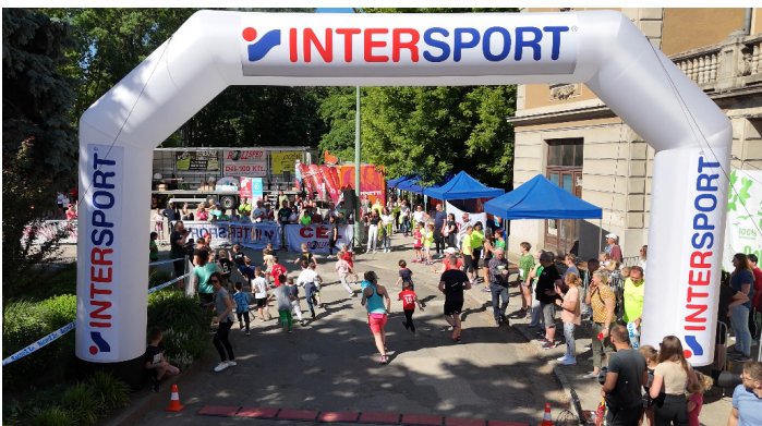
Rollsped ist stolzer Sponsor des Petőfi 1848 Memorial Run