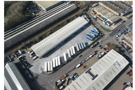
Roberts Transport's new site at Wick

auf unsere Kunden – unsere hohen Standards in Betrieb und Service konnten wir jederzeit aufrechterhalten. Wir sind überzeugt, dass uns dieser Schritt hilft, auch künftig einen erstklassigen Logistikservice zu bieten.“