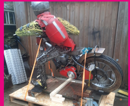
Original motorcycle sculpture

angekommen ist. Es handelt sich um ein wichtiges Erinnerungsstück, das nun außerhalb des Stadions ausgestellt ist, um Ronnie, einen Giganten des britischen Speedway, zu ehren und die Geschichte des Wimbledon Speedway zu feiern.“