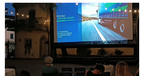
Palletways Italien ist stolzer Sponsor von CinemaDivino und zeigt damit sein Engagement für den italienischen Weinsektor

Weinverkostungen und der Entdeckung regionaler Besonderheiten. Das Festival startete in Casa Spadoni in Faenza mit dem Film Complete Unknown und setzte sich mit Titeln wie Wim Wenders' „Perfect Days“ (Imola, 10. Juli), „Back to Black“, dem Amy-Winehouse-Biopic (Galeata, 16. Juli) und der feinen Komödie „Romeo and Juliet“ (zweimal in Mercato Saraceno) fort. Das große Finale bildete „The Intern“ inmitten der Weinreben des Weinguts Azienda Agricola Giovannini. Die Unterstützung von CinemaDivino bedeutet, Kultur auf zugängliche Weise zu fördern und gleichzeitig regionale Werte und Orte zu stärken. Diese Initiative bestätigt auch unser Engagement für den Weinsektor, der einen geschätzten Wert von 8,1 Milliarden Euro hat und ein strategischer Pfeiler der italienischen Wirtschaft ist. Unser gesamtes Mitgliedsnetzwerk arbeitet kontinuierlich daran, die Anforderungen an Pünktlichkeit und Transportqualität zu erfüllen – und trägt damit zur Förderung eines der wichtigsten Symbole des „Made in Italy“ bei.